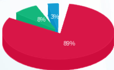
התפלגות חיוב בש"ח לפי תעו"ז