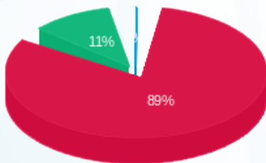
התפלגות חיוב בש"ח לפי תעו"ז