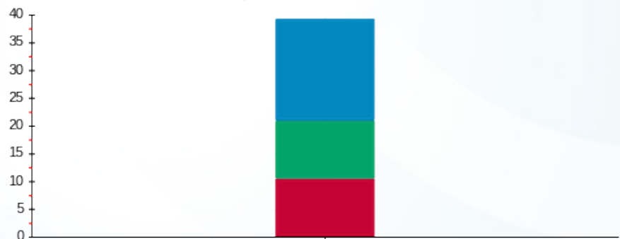
הסטוריית צריכה בקוט"ש