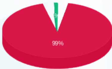
התפלגות חיוב בש"ח לפי תע"ז