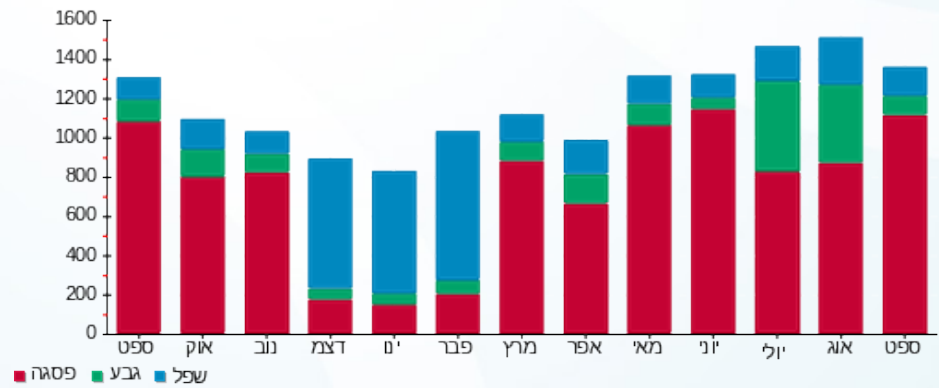
הסטוריית צריכה בקוט"ש

■ פסגה (501.01 ₪) ■ גבע (37.30 ₪) ■ שפל (45.58 ₪)