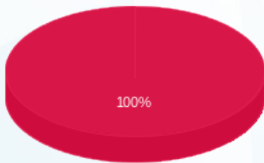
התפלגות חיוב בש"ח לפי תע"ז