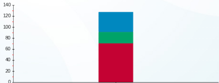
הסטוריית צריכה בקוט"ש

פסגה (₪ 30.55) גבע (₪ 7.55) שפל (₪ 11.05)