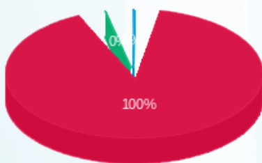
התפלגות חיוב בש"ח לפי תעו"ז

פסגה (34.09 ₪) גבע (0.04 ₪) שפל (0.10 ₪)