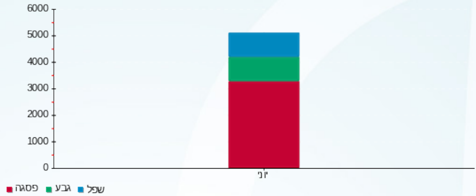
הסטוריית צריכה בקוט"ש

■ פסגה (ש"ח 410.40) ■ גבע (ש"ח 63.62) ■ שפל (ש"ח 48.23)