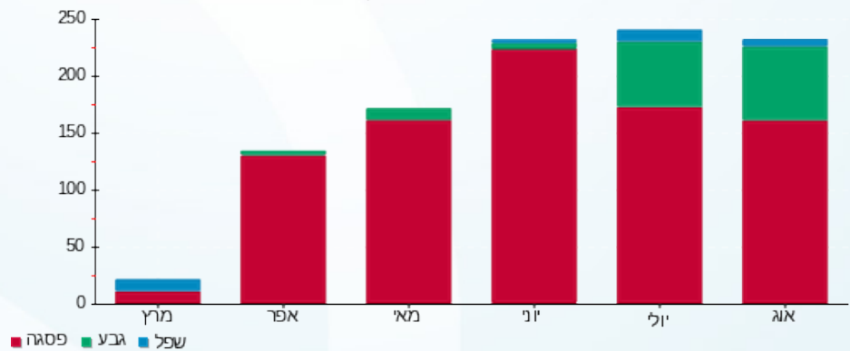
הסטוריית צריכה בקוט"ש

פסגה (177.73 ₪) גבע (29.31 ₪) שפל (1.83 ₪)