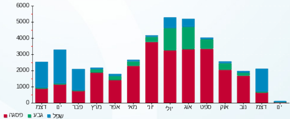
הסטוריית צריכה בקוט"ש

פסגה (638.89 ₪) ■ גבע (23.83 ₪) ■ שפל (564.47 ₪) ■