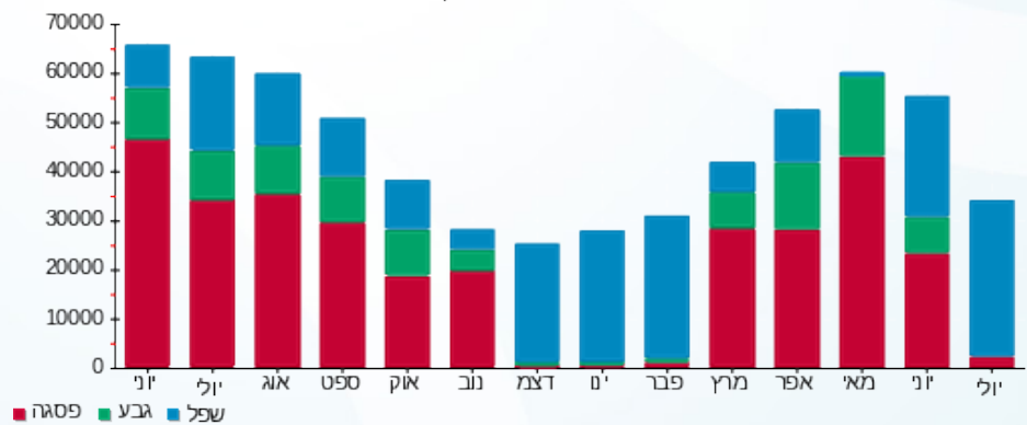
הסטוריית צריכה בקוט"ש

■ פסגה (9,711.53 ₪) 65% ■ גבע (627.66 ₪) 2% ■ שפל (19,322.48 ₪) 33%