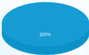
התפלגות חיוב בש"ח לפי תע"ז