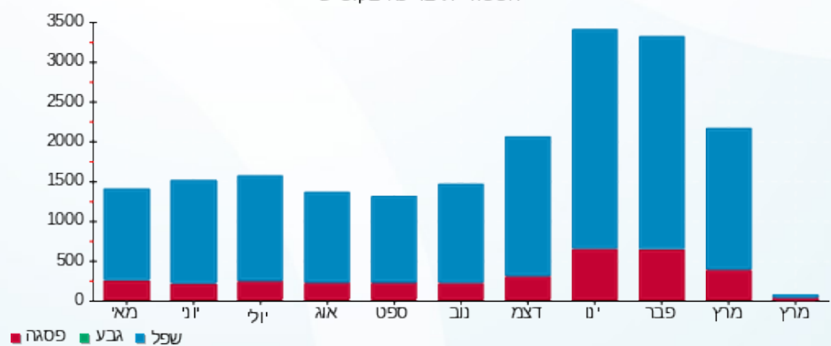
הסטוריית צריכה בקוט"ש

■ פסגה (143.78 ₪) ■ גבע (0.00 ₪) ■ שפל (628.30 ₪)