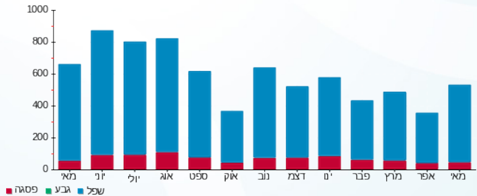
הסטוריית צריכה בקוט"ש

פסגה (15.01 ₪) גבע (0.00 ₪) שפל (171.61 ₪)