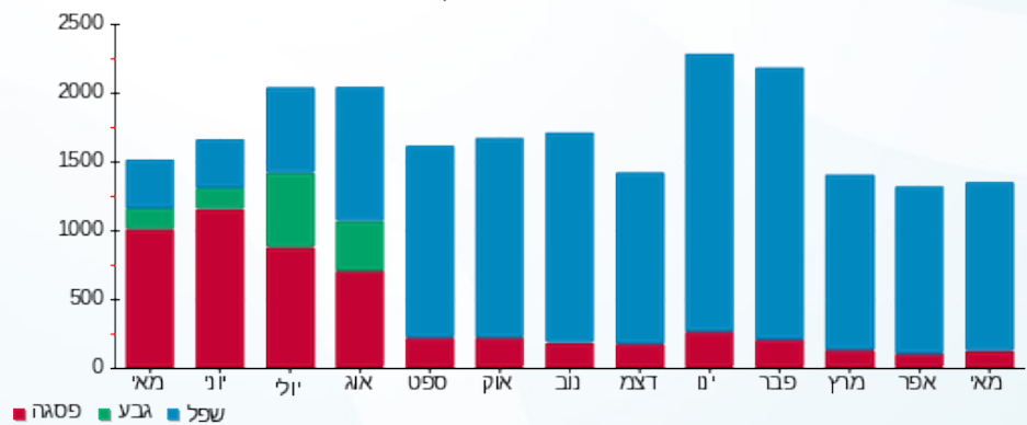
הסטוריית צריכה בקוט"ש