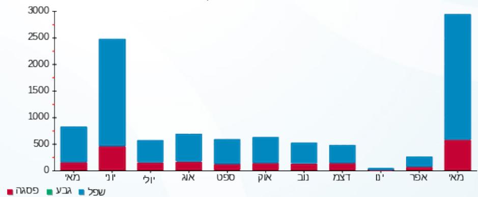
הסטוריית צריכה בקוט"ש