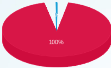
התפלגות חיוב בש"ח לפי תעו"ז