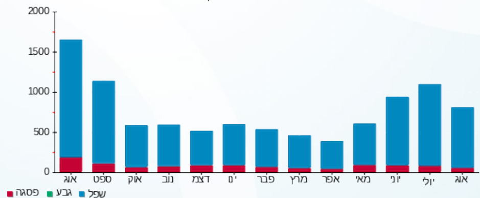
הסטוריית צריכה בקוט"ש

פסגה (59.29 ₪) גבע (0.00 ₪) שפל (316.68 ₪)