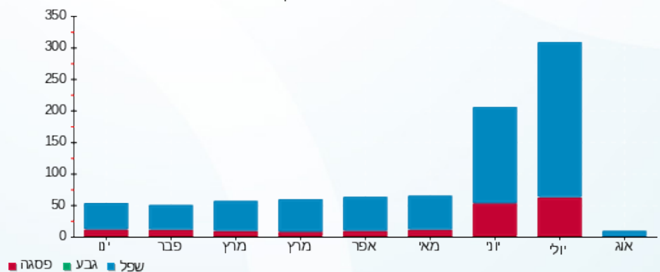
הסטוריית צריכה בקוט"ש

פסגה (₪ 81.43) ■ גבע (₪ 0.00) ■ שפל (₪ 102.04) ■