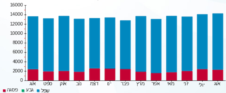
הסטוריית צריכה בקוט"ש

■ פסגה (3,077.53 ₪) ■ גבע (0.00 ₪) ■ שפל (5,015.05 ₪)