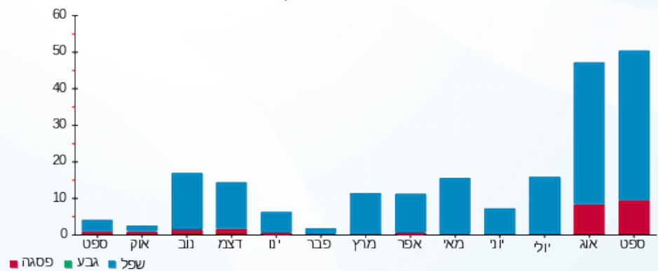
הסטוריית צריכה בקוט"ש