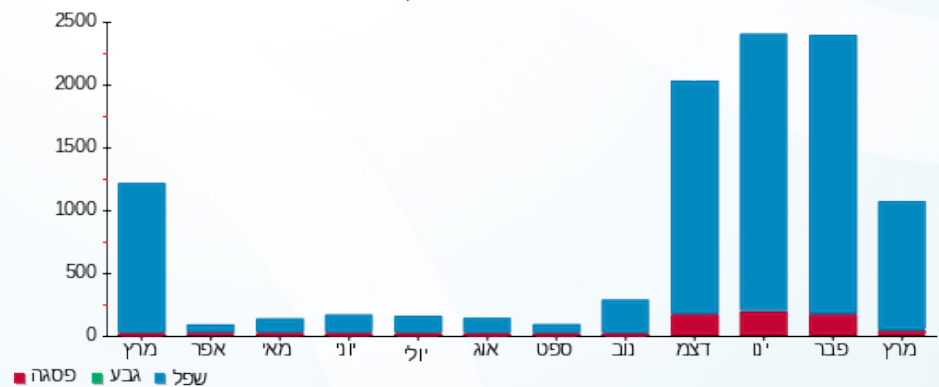
הסטוריית צריכה בקוט"ש

פסגה (16.73 ₪) גבע (0.00 ₪) שפל (617.57 ₪)