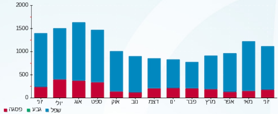
הסטוריית צריכה בקוט"ש