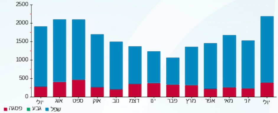
הסטוריית צריכה בקוט"ש