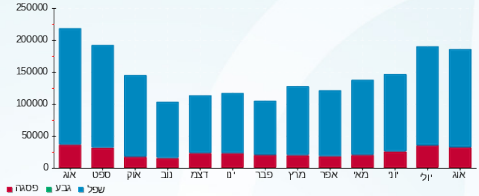
הסטוריית צריכה בקוט"ש