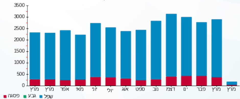
הסטוריית צריכה בקוט"ש

■ פסגה (157.21 ₪) ■ גבע (0.00 ₪) ■ שפל (1,050.71 ₪)